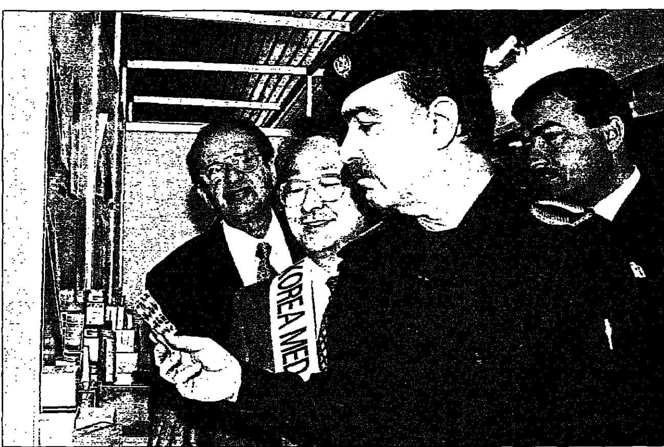
وزير الصحة العراقي ارميد مدحت مبارك يهضن ادوية في معرض نفلته شركات كبرى في بغداد